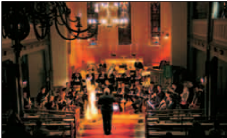
TIL BØ: Det norske blåseensemble kommer til Bø kirke på søndag blant annet for å fremføre Mussorgsky sitt verk «Pictures at an Exhibition».